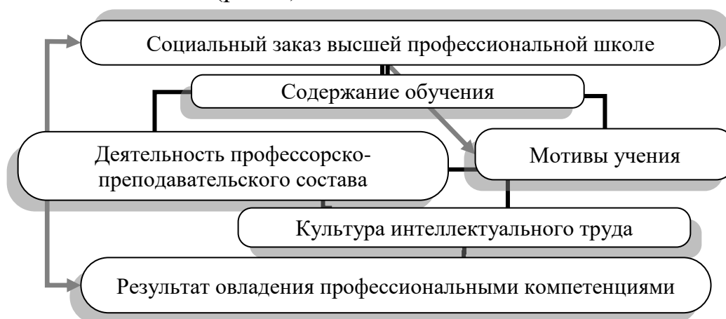
Рисунок 1 – Место культуры интеллектуального труда в структуре подготовки будущего специалиста.

образования. Аналогично процессу обучения в школе данный процесс можно представить в виде схемы (рис. 1).