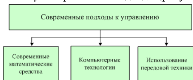
Рисунок 2 – Современные подходы к управлению предприятием.

С переходом на рыночные отношения возникло большое количество частных малых и средних предприятий с неквалифицированным персоналом, которые в условиях конкуренции с крупными предприятиями способны «выжить» лишь в том случае, если будут более адекватно и оперативно изменять свою деятельность в соответствии с меняющейся ситуацией, если будут использоваться самые передовые системы управления. Создание таких систем, возможно используя современные подходы (рисунок 2).